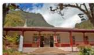
Museo Quinta de Bolívar