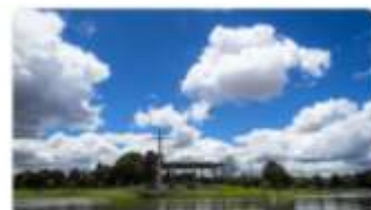
Parque Metropolitano Simón Bolívar