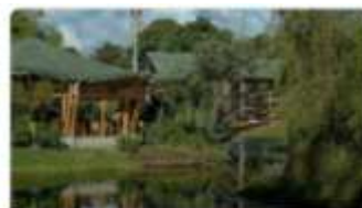
Jardín Botánico de Bogotá José Celestino