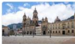
Plaza de Bolívar