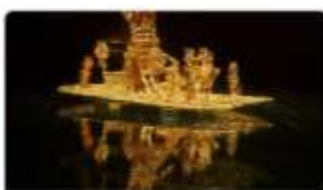
Museo del Oro