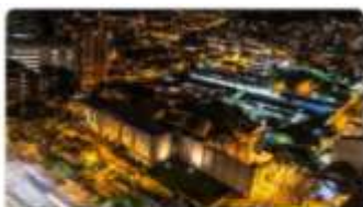
Museo Nacional de Colombia